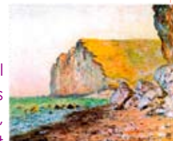
Edouard Manet, Les Falaises des Peuples Normands, 1884 Musée d'Orsay, Paris

La terre d'inspiration et de travail des peintres Monet, Delacroix et des écrivains Maupassant, Victor Hugo, Flaubert, Jules Verne et de tant d'autres artistes.