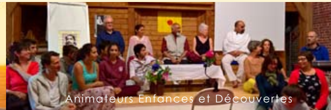
Animateurs Enfances et Découvertes