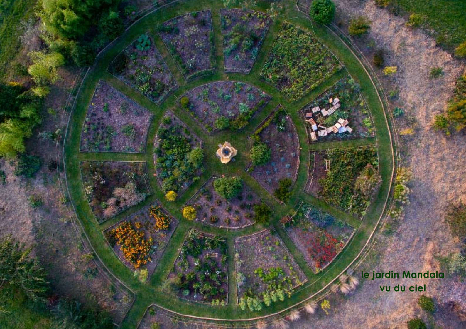
le jardin Mandala vu du ciel