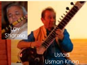
Ustad Usman Khan