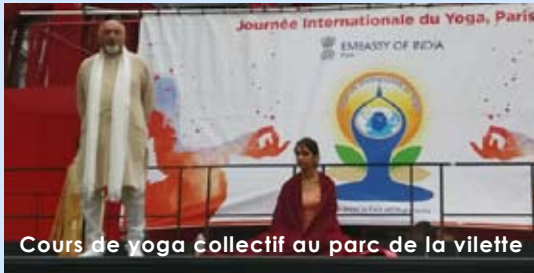
Cours de yoga collectif au parc de la vilette