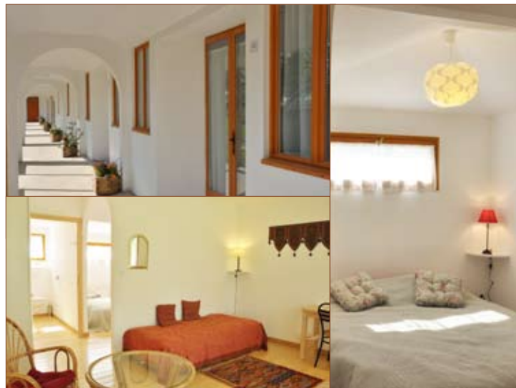
Studio Surya les nouvelles chambres de Tapovan

. toute semaine de cure, formation ou stage commencée est dûe dans son intégralité (sauf avis médical).